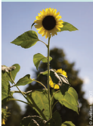
Jardin Camifolia - Chemillé / CHEMILLÉ-EN-ANJOU

En cas de déménagement, compléter le formulaire de déménagement disponible sur www.maugescommunaute.fr ou contacter le service au 02 41 71 77 55 .