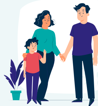
Le soutien à l'aidant