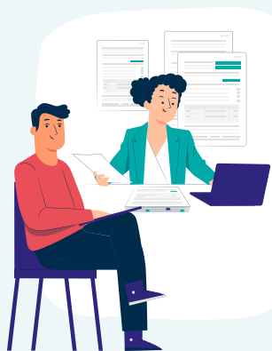
Les démarches administratives et la complétude du dossier MDA