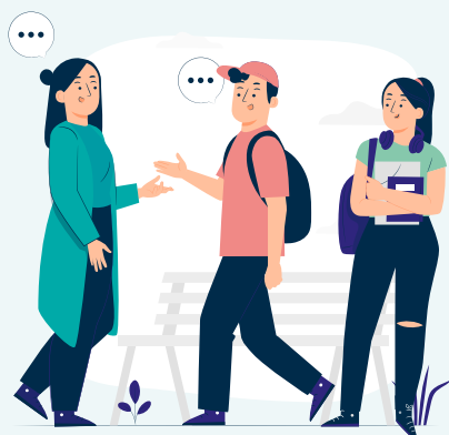
Les services favorisant le maintien à domicile