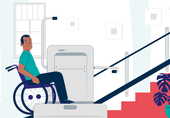
L'adaptation de l'habitat