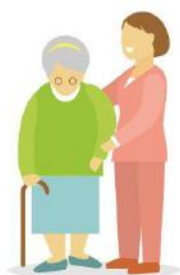
Les services d'aide et de soins à la personne

Le CLiC (Centre Local d'Information et de Coordination) de Mauges Communauté vous accompagne, évalue vos besoins, vous renseigne et vous oriente vers les organismes compétents pour tout ce qui concerne :