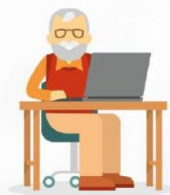
L'aide aux démarches administratives et à la constitution de dossiers d'aides financières