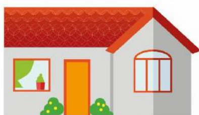
Les différents modes d'accueil et structures d'hébergement