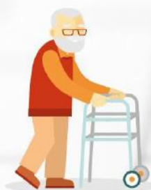
L'adaptation de l'habitat