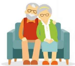
Le soutien à l'aidant