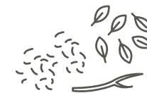
Feuilles mortes, brindilles, bois broyé...