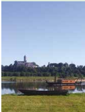
Saint-Florent-le-Vieil / MAUGES-SUR-LOIRE

En cas de déménagement, compléter le formulaire de déménagement disponible sur www.maugescommunaute.fr ou contacter le service au 02 41 71 77 55 .