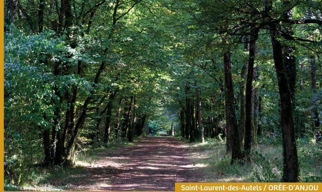
Saint-Laurent-des-Autels / ORÉE-D'ANJOU