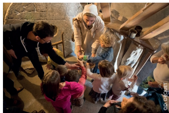
Animation au Moulin de l'Épinay