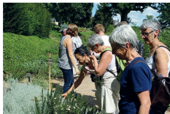
Visite guidée au Jardin Camifolia