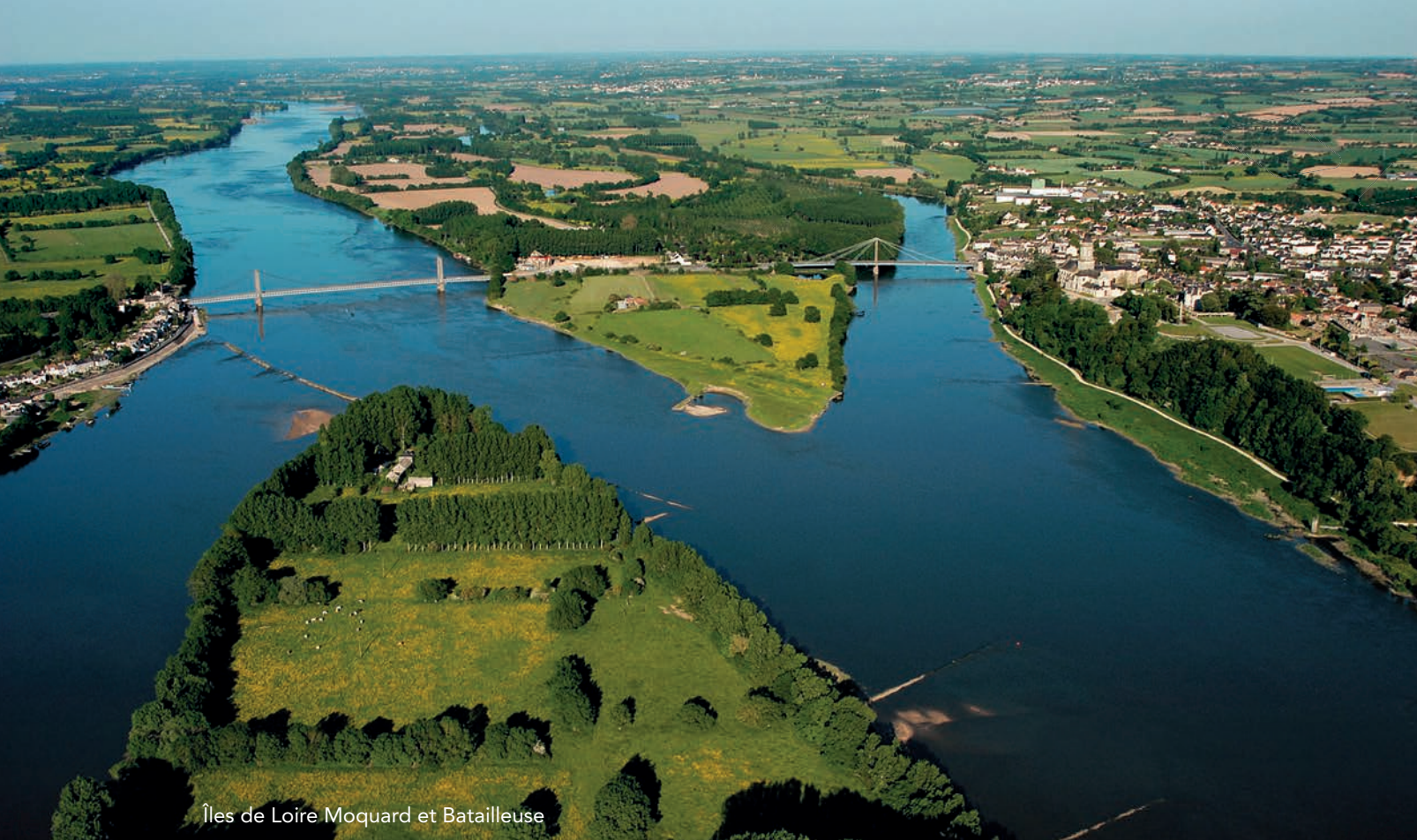
Îles de Loire Moquard et Batailleuse