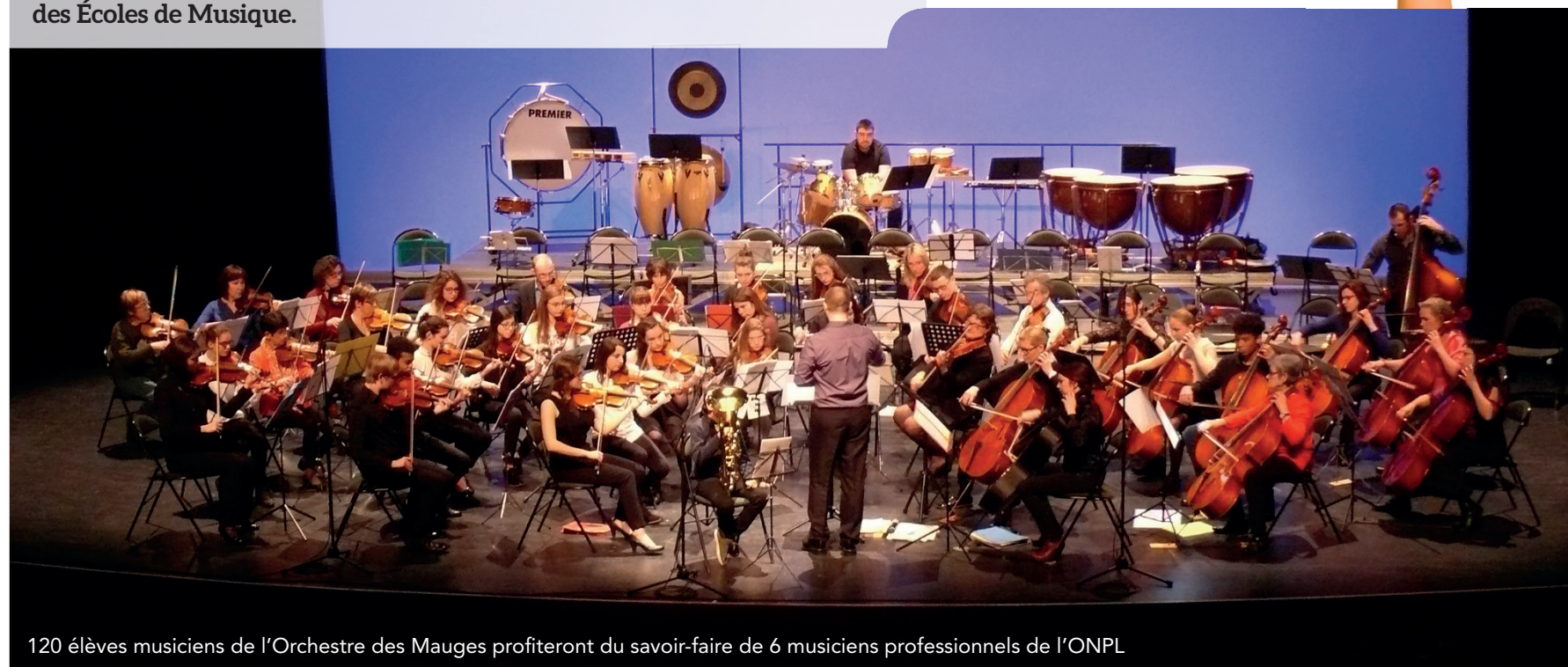
120 élèves musiciens de l'Orchestre des Mauges profiteront du savoir-faire de 6 musiciens professionnels de l'ONPL