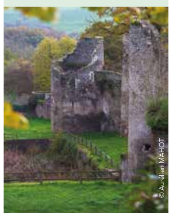
La Turmelière - Liré / ORÉE-D'ANJOU

En cas de déménagement, compléter le formulaire de déménagement disponible sur www.maugescommunaute.fr ou contacter le service au 02 41 71 77 55 .